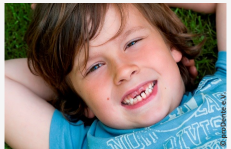
Bei der Prophylaxe lernen Ihre Kinder die richtige Zahnpflege

Es gibt also keinen Grund, warum Sie auf Prophylaxe für Ihre Kinder verzichten sollten.