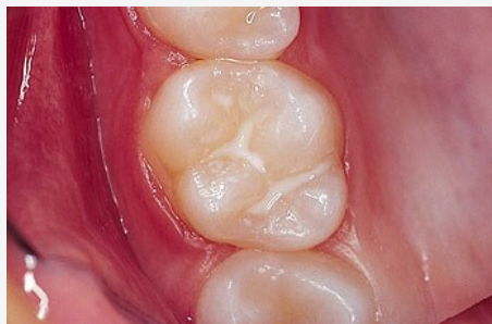
Schutz vor Karies: Versiegelung der feinen Grübchen auf der Kaufläche

Bei der Versiegelung werden die Fissuren mit einem hellen Kunststoff dauerhaft verschlossen, so dass an diesen Stellen keine Karies mehr entstehen kann (siehe Abb. unten).